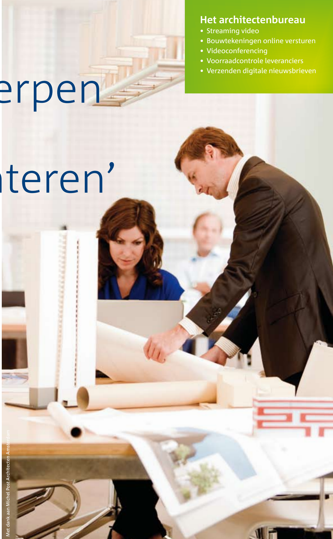
Met dank aan Michel Post Architecten Amsterdam

‘Ons architectenbureau heeft zakelijke klanten over de hele wereld. Met onze Zakelijk Internet-verbinding van 50 Mbit/s vergaderen we online via videoconferencing met onze opdrachtgevers in Hongkong. En tegelijkertijd kunnen we gedetailleerde 3D-bouwtekeningen presenteren. Zonder haperingen kunnen we met elkaar overleggen en elkaar ook zien, dat scheelt veel tijd en geld. Met Zakelijk Glas hebben